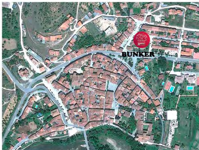
BUNKER CULTURAL. AV. VÍCTOR BARBADILLO S/N. COVARRUBIAS. BURGOS